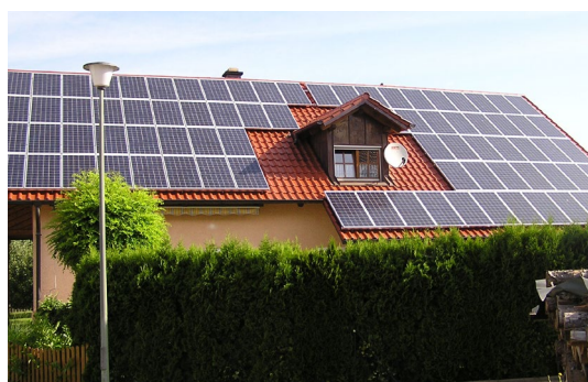
Fertig montierte Anlage mit einem IBC TopFix 200 in Verbindung mit TIGO-Optimizern